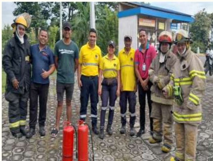
ESTACION DE SERVICIOS PRYSCA