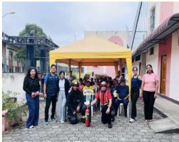
PATRONATO MUNICIPAL DE BALZAR