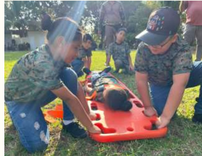
CENTRO DE FORMACIÓN START GOOD